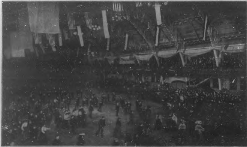
Una vista del hermoso salón de patinar de Chicago, a cuya Empresa pertenece el amplio salón construido en los terrenos del nuevo Palacio Presidencial, de esta capital.

tenor de fama y deleitará al auditorio con una composición del señor Eduardo Sánchez de Fuentes, acompañado al piano por su autor.