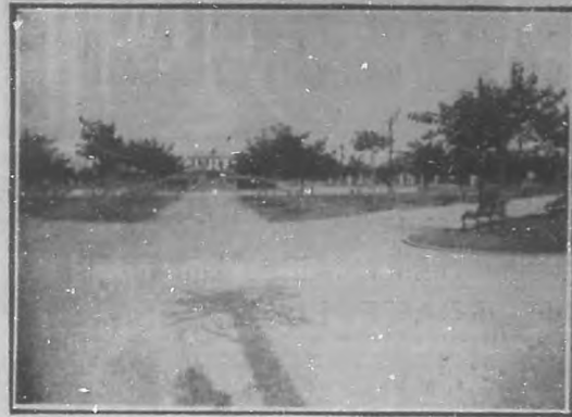
Los progresos urbanos. "Parque Menocal", Vedado.

LAS CASAS, en Luyanó; LA SERAFINA, BUEN RETIRO, LOMA LLAVES, ORIENTAL y COUNTRY CUB PARK, en Marianao y en el Cerro (Calzada de Ayesterrán) en la Víbora y el Vedado.