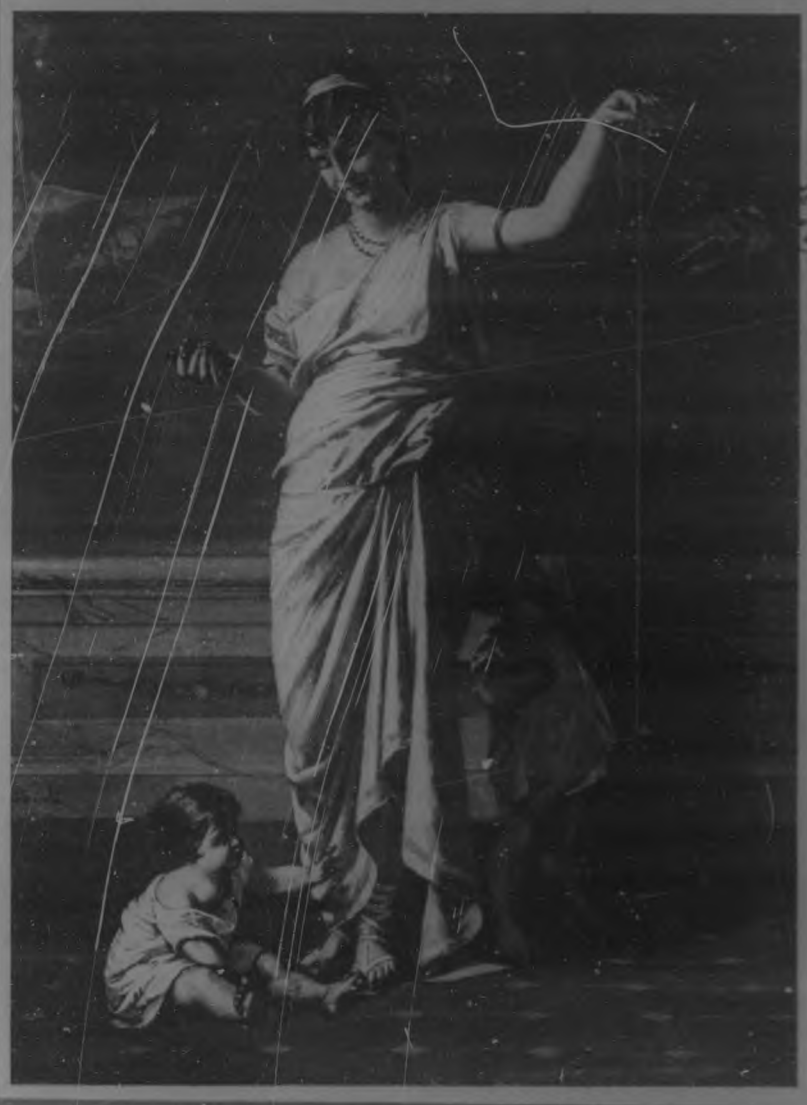
"ESCENA DOMESTICA DE LOS TIEMPOS CLASICOS". Cuadro de Amós Cassioli.