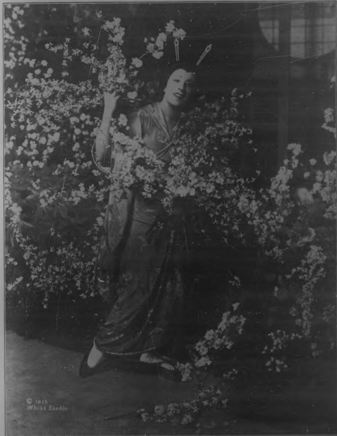
La eminente Lucrecia Bori en el papel de "Iris", ópera del maestro Mascagni, representada con éxito extraordinario en el "Metropolitan" de Nueva York.