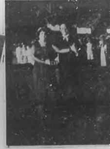
EN EL "AMERICAN ROLLER SKATING RINK".—Varias vistas de dicho lugar. En ellas pueden verse la entrada, el salón de patinar y un grupo de jóvenes concurrentes.

mentados y dirigidos por un maestro tan insigne como genial autor.